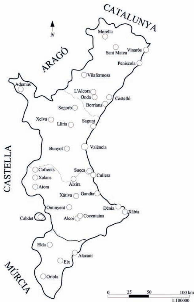
Figura 1. Mapa del Regne de València